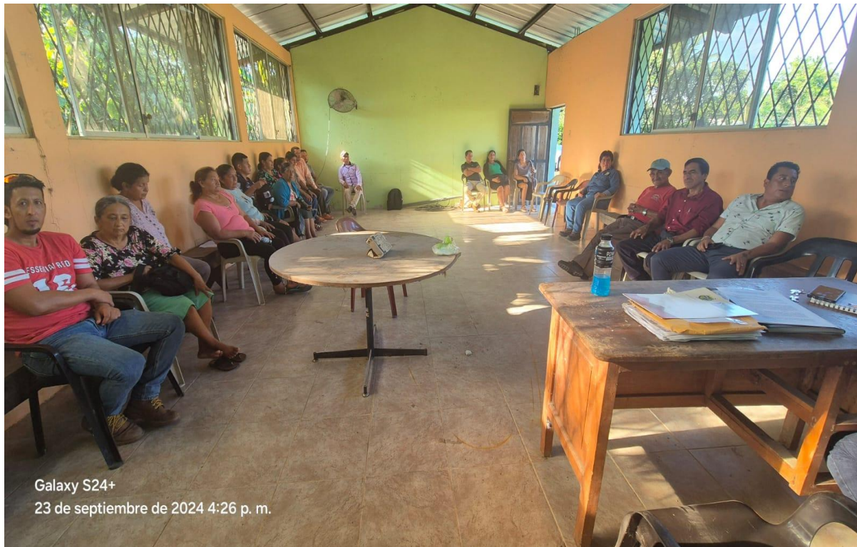
Galaxy S24+ 23 de septiembre de 2024 4:26 p. m.