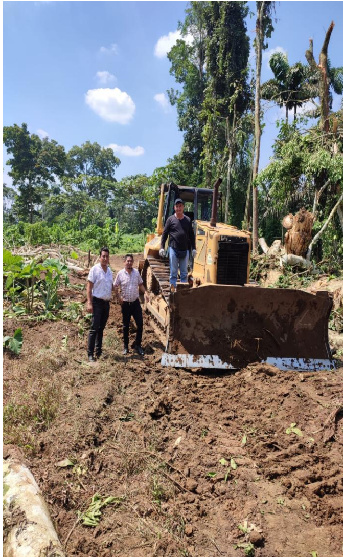
✓ Comunidad Parutuyacu